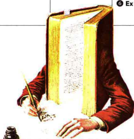
Un cuore in estate The Illustrator (2005) © Jonathan Wolstenholme Bridgeman Images